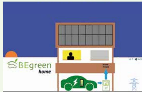
08:00 Al despertar-se La bateria del cotxe suministra la casa