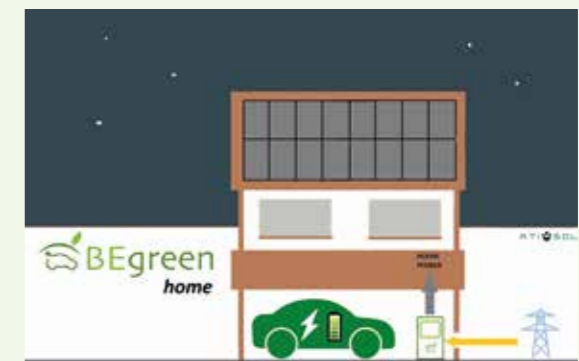
06:30 De bon matí La xarxa proveeix la casa. Bateria del cotxe carregada. Balanç d'energia verda. Reducció de la factura de la llum

* Nota: en cas que el consum de casa sigui molt elevat i l'energia de la bateria del cotxe i de les plaques solars no sigui suficient, la xarxa proveirà l'energia restant per alimentar la casa