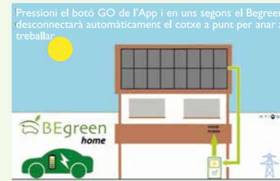
09:00 Cap a la feina El sol proveeix la casa