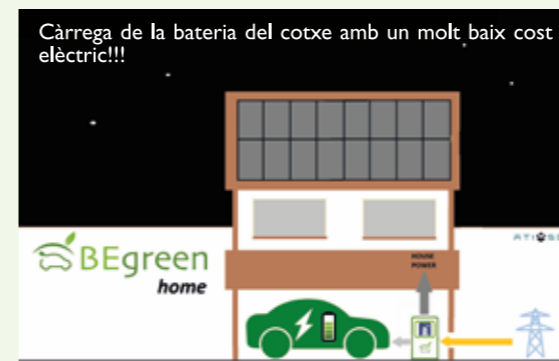
24:00 Mitjanit La xarxa proveeix la casa i carrega la bateria del cotxe