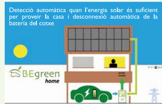
08:30 Hora d'esmorzar El sol i la bateria del cotxe proveeixen la casa