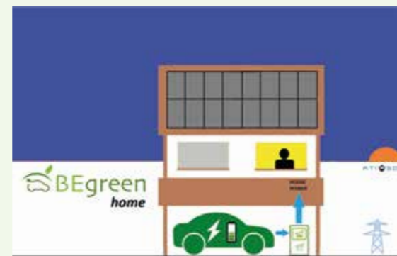
20:00 Vespre La bateria del cotxe proveeix la casa