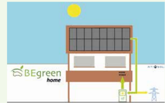
12:00 Migdia El sol proveeix la casa i alimenta la xarxa