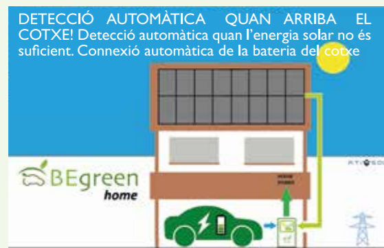
17:00 Tornada a casa El sol i la bateria del cotxe proveeixen la casa