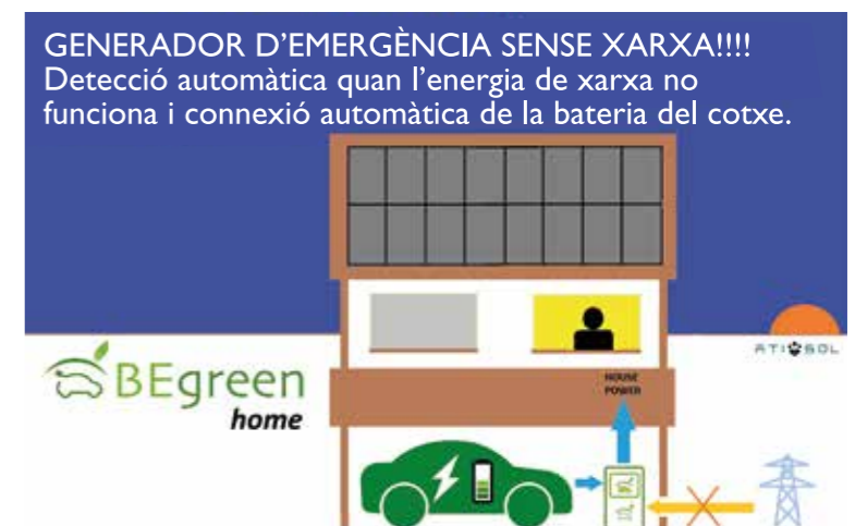
Funcionament d'emergència sense xarxa. Generador d'energia. La bateria del cotxe proveeix la casa